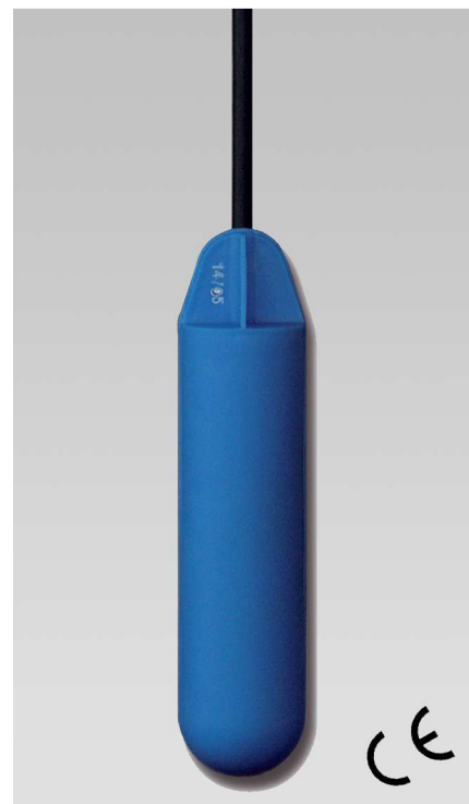
VR - ECO

JEDYNĄ CECHĄ ODRÓŻNIAJĄCĄ TO URZĄDZENIE OD PŁYWAKA TYPU TUBA 1" JEST WIĘKSZA ŚREDNICA ZEWNĘTRZNA 1"1/4.